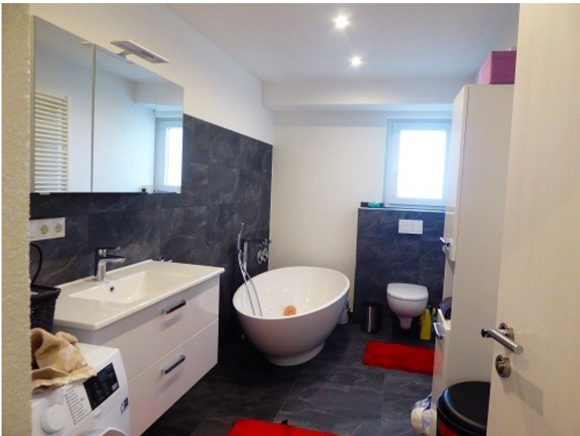
Badezimmer mit WC und Badewanne