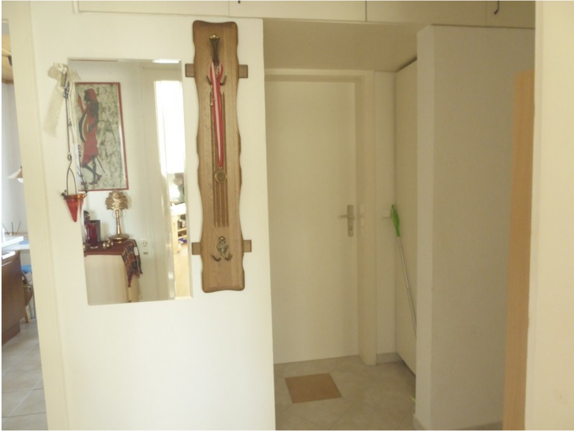
Garderobebereich im Flur