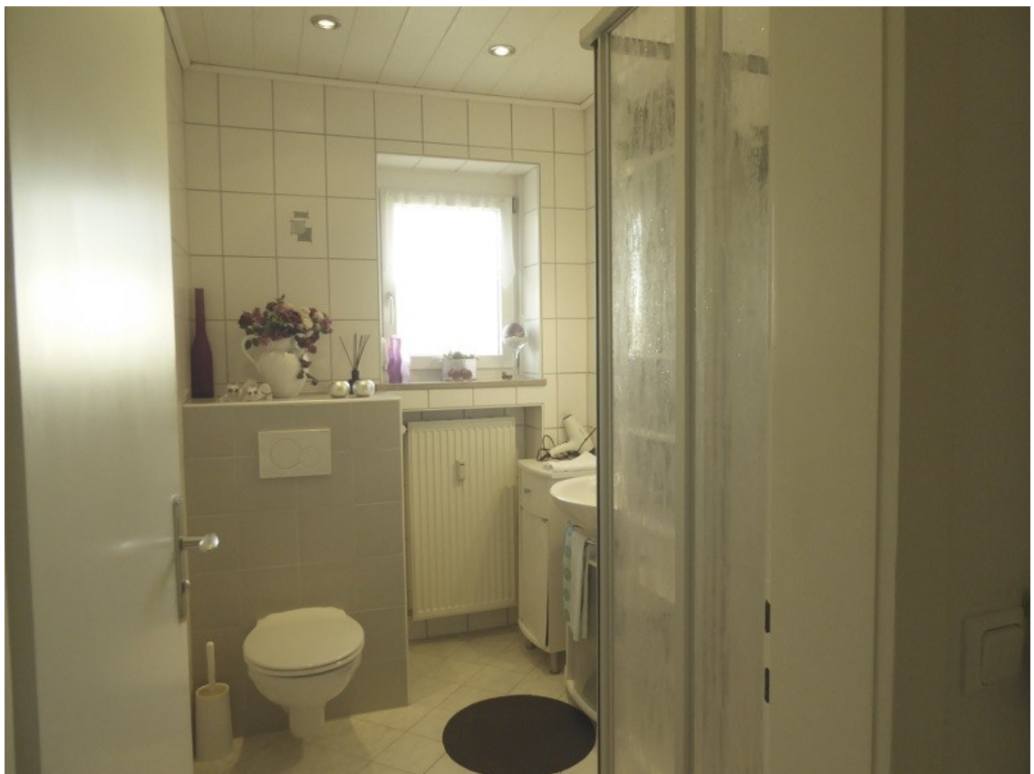
Badezimmer mit WC und Dusche